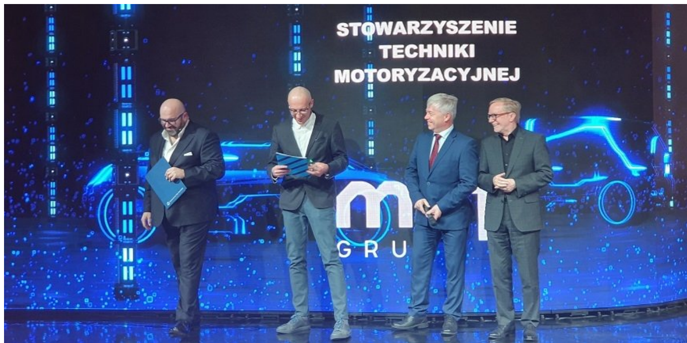
Fot. Gala wręczenia nagród Trade Press Award 2019.